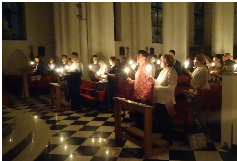
Пасхальная месса в Церкви Пресвятой Богородицы. 07.04.2018

Не получается у меня написать что-то, что не было бы связано с концертной программой нашего прихода. На сей раз я хочу поделиться с вами размышлениями на тему одного из произведений, звучавшего на наших пасхальных концертах. Вернее, я хочу обратиться не к самому произведению, а к литургическому тексту, который вдохновил композитора. Вот как может случиться: услышав прекрасную музыку, ты возвращаешься к тексту и понимаешь, насколько этот текст может помочь нам, христианам, проникнуть в тайну Пасхи. Подождите, скажете вы, причем здесь Пасха? Мы уже совсем запутались – концерты, музыка, текст, теперь еще и Пасха. Какая здесь связь? Обо всем по порядку.