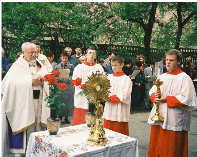
Игорь Лукин (крайний справа) – министр на процессии в праздник Тела и Крови Христа. 1997 г.

будем просить Бога даровать душе Игоря покой и жизнь вечную.